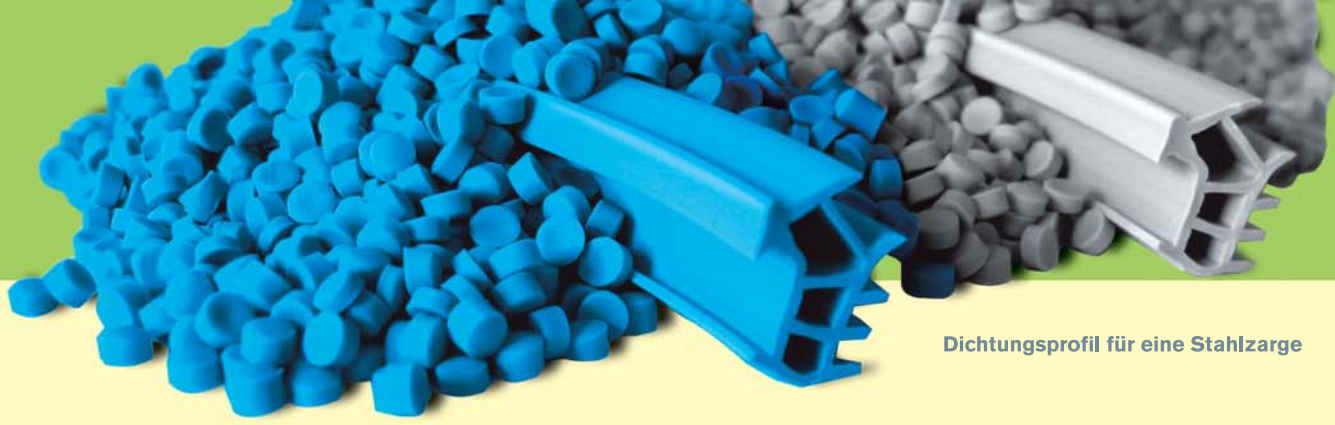
Dichtungsprofil für eine Stahlzarge