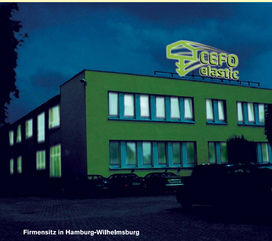
Firmensitz in Hamburg-Wilhelmsburg

Ein ganz entscheidender Vorteil für unsere Kunden ist unsere Kompetenz. Von der Beratung bei der Produktentwicklung, über die Konstruktion, den Werkzeugbau und die Produktion bis hin zum Vertrieb finden alle Prozesse im eigenen Hause statt. Für den Kunden bedeutet dies: ein Ansprechpartner, umfassender Service und nicht zuletzt ein entscheidender Preisvorteil ohne Zwischenhandel.